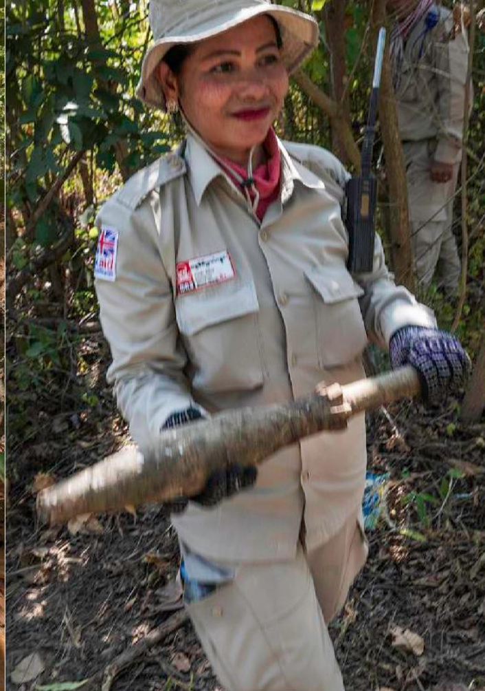
FOTOS SUPERIORES: Un equipo de EOD revisa la granada propulsada por cohete y los morteros que esta beneficiaria camboyana y su esposo encontraron en su campo, antes de retirarlos de forma segura para su destrucción en otro lugar.