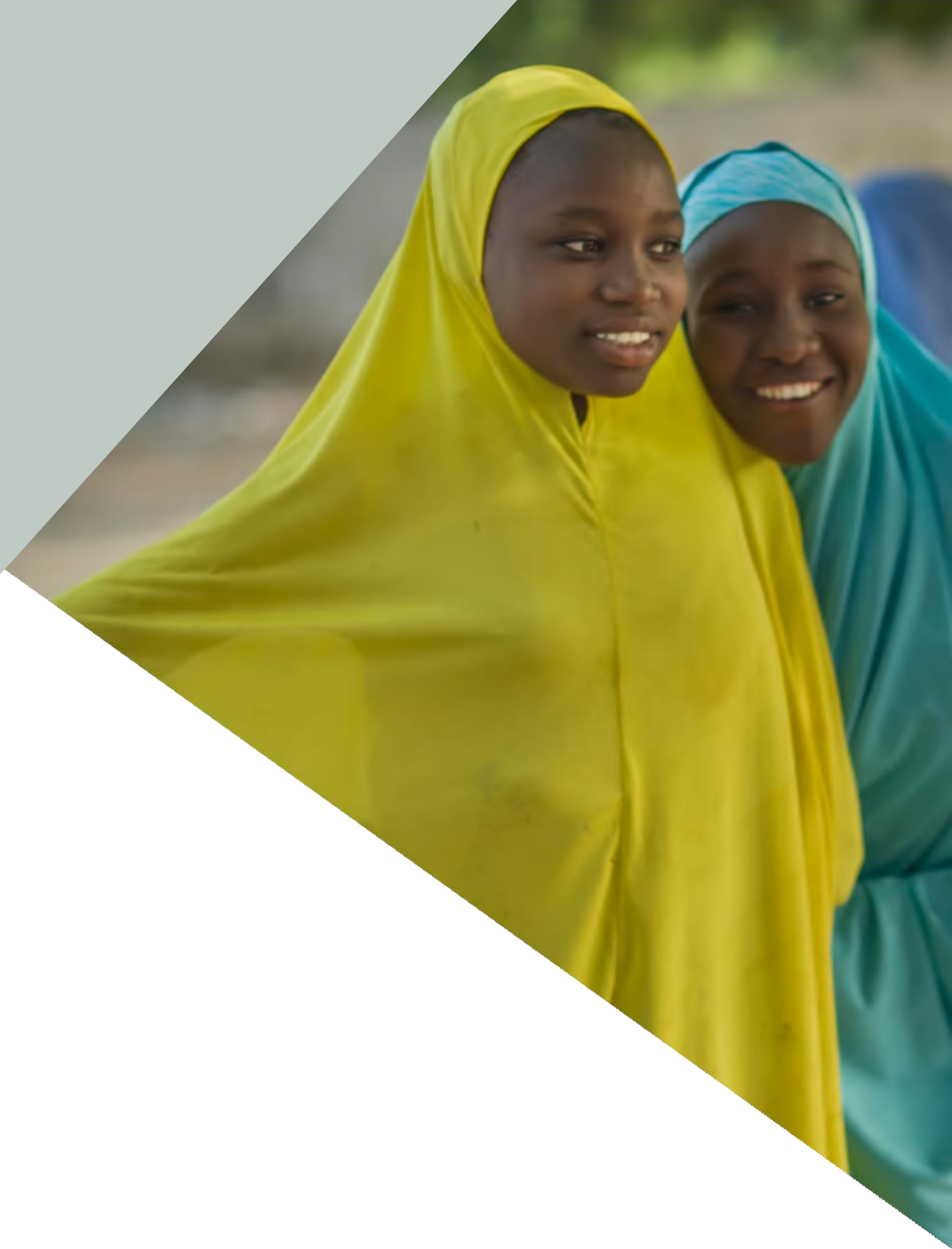
FOTO SUPERIOR: Mujeres jóvenes en el pueblo de Ngamari, Nigeria.