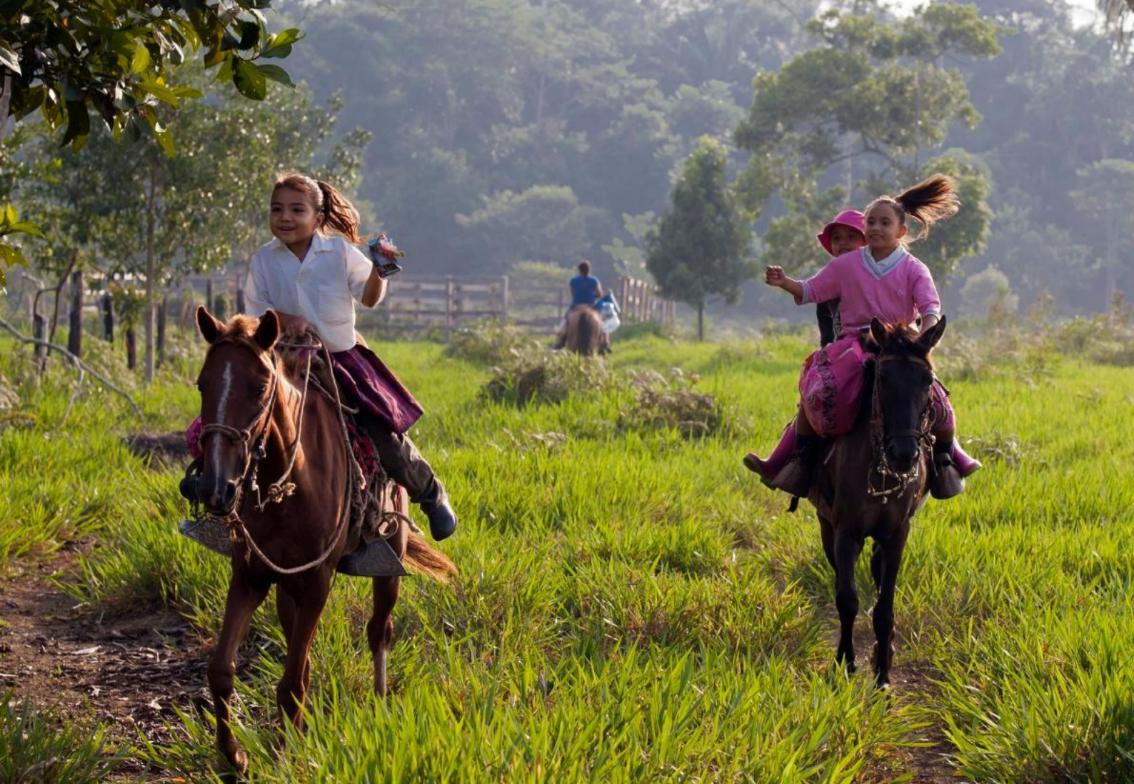
FOTO SUPERIOR: Niños de la Escuela Primaria Santa Helena en sus caballos temprano en la mañana. Algunos de estos niños vienen viajando durante dos horas. Santa Helena, Departamento Del Meta, Colombia.

● En los casos en que varias familias pueden residir en la misma unidad habitacional, los operadores deben definir a los miembros del hogar como "las personas que viven juntas y que hacen provisión común de alimentos u otros elementos esenciales para la vida" 21 . Además, para evitar cifras exageradas de beneficiarios directos, el operador debe determinar la extensión del hogar a aquellos que residen de forma permanente o regular en la misma unidad habitacional y no debe incluir miembros de la familia extendida que vivan en otro lugar (a menos que también se identifiquen como parte de quienes usan/ usarán la tierra despejada y reducida post-despeje).