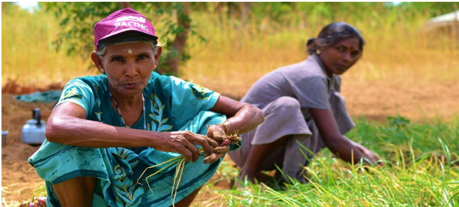
FOTO A LA DERECHA: Vida en una antigua área minada en Sudán del Sur.

FOTO INFERIOR: Cosechando cebollas en tierra despejada en Sri Lanka.