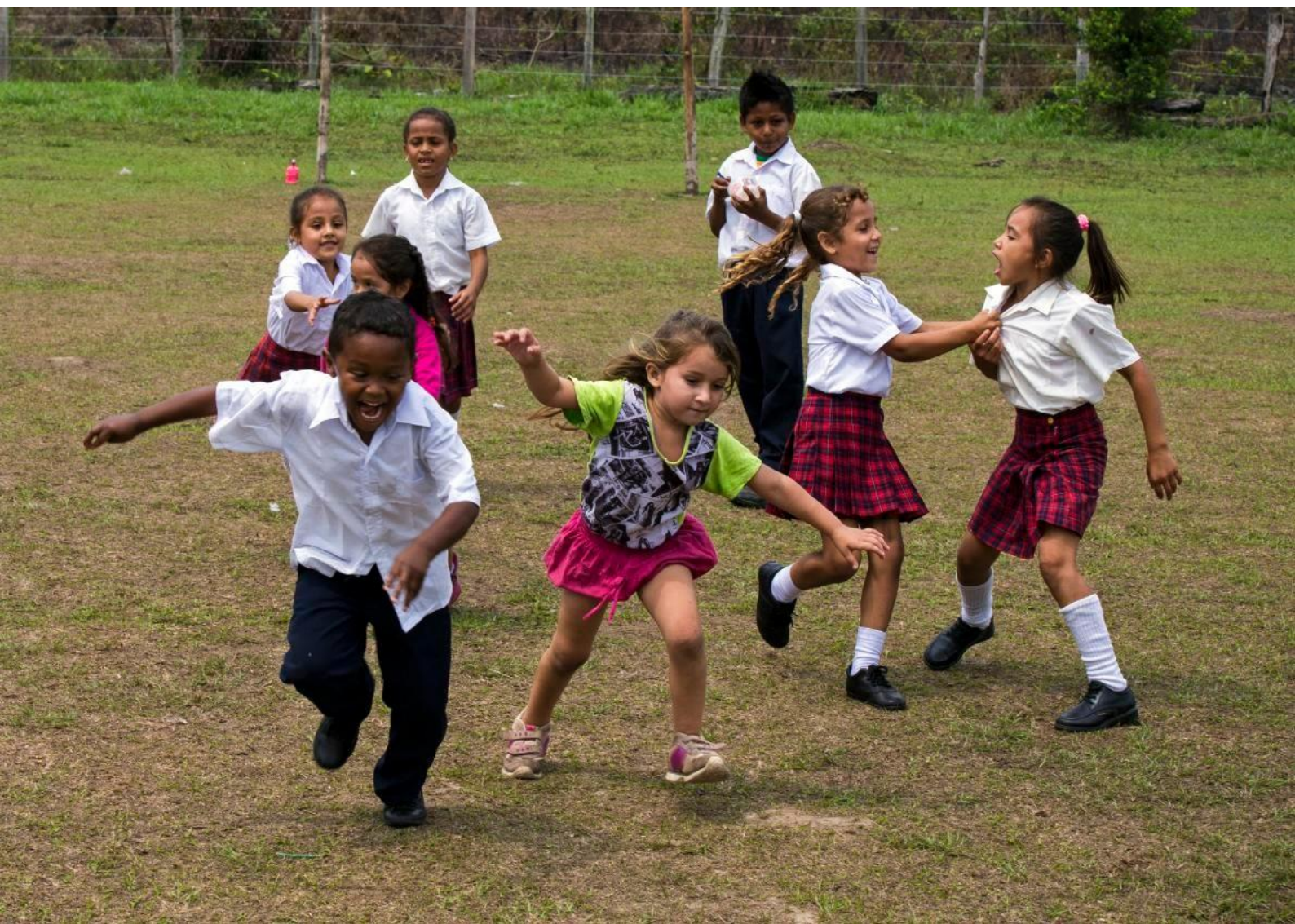
FOTO INFERIOR: Niños jugando en el patio de una Escuela Primaria, Santa Helena, Meta, Colombia.