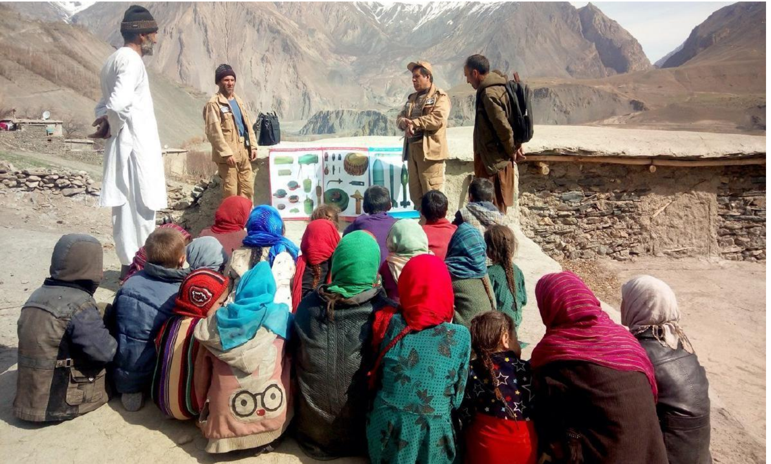
FOTO ARRIBA: La región montañosa de Darwaz, en el noreste de Afganistán, sigue estando muy contaminada por minas antipersonal. Los niños de la aldea de Janmarje Bala necesitan saber cómo reconocer restos explosivos de guerra y no acercarse a ellos cuando juegan al aire libre.

Al describir el alcance y el impacto a nivel macroeconómico, o en los casos en que la información recopilada directamente acerca de personas con discapacidad sea delicada o de otro modo inaccesible, se pueden obtener datos de fuentes gubernamentales u otras fuentes secundarias.