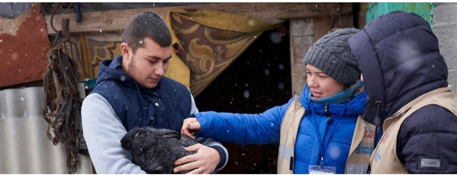
FOTO INFERIOR: Este adolescente perdió tres dedos de su mano derecha debido a un incidente con una mina en el este de Ucrania en 2017. A pesar del uso limitado de su mano, tuvo la capacidad de continuar sus estudios después de conseguir un computador portátil a través de un programa de asistencia a víctimas.