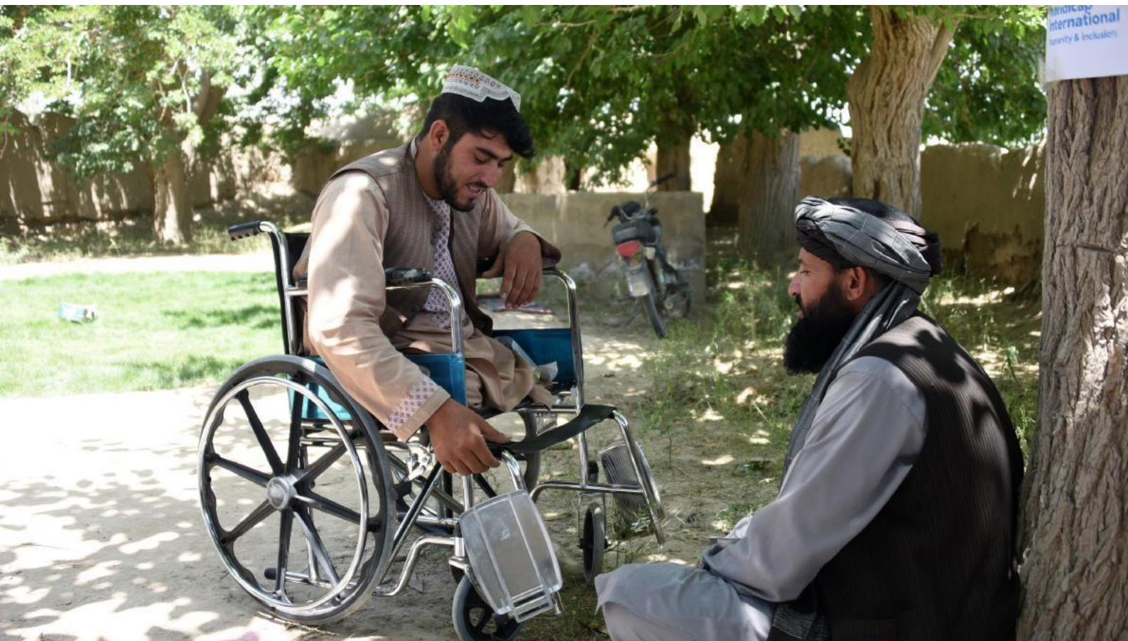
FOTO INFERIOR: En Afganistán, este hombre que resultó herido en un accidente por minas ha recibido servicios de rehabilitación física y tratamiento para la debilidad muscular.