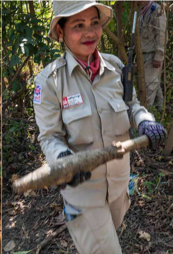
រូបភាពខាងលើ៖ ក្រុមការងារ EOD កំពុងត្រួតពិនិត្យគ្រាប់កាំភ្លើងបេបាញ់គ្រាប់រ៉ុកែត និងគ្រាប់កាំភ្លើងគ្យាល់ដែលអ្នកទទួលផលជាជនជាតិកម្ពុជា និងប្តីរបស់គាត់បានរកឃើញនៅក្នុងដីរបស់ពួកគេ មុនពេលដែលវាត្រូវបានយកចេញទៅកម្ទេចនៅកន្លែងផ្សេងៗ ។