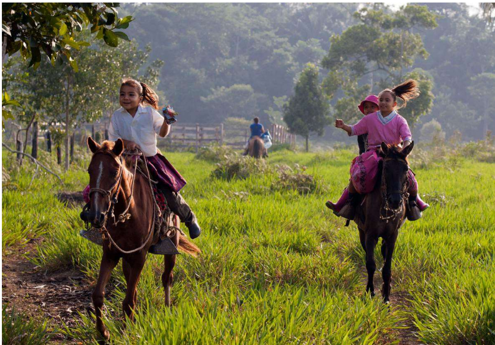
រូបភាពខាងលើ៖ ក្មេងៗពីសាលាសាបបមសិក្សា Santa Helena កំពុងជិះសេះរបស់ពួកគេនៅពេលព្រឹក។ កុមារទាំងនេះអ្នកខ្លះមកពីទីដែលត្រូវចំណាយពេលធ្វើដំណើរពីរម៉ោង។ Santa Helena តំបន់ Meta ប្រទេសកូឡុំប៊ី