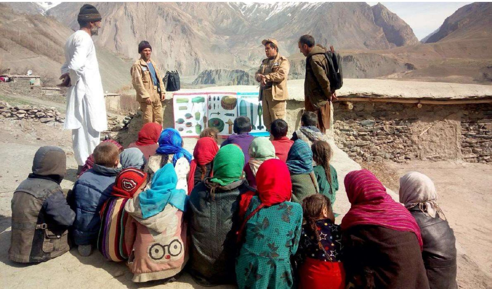
រូបភាពខាងលើ៖ តំបន់ភ្នំ Darwaz នៅភាគឦសាននៃប្រទេសអាហ្វហ្គានីស្ថាននៅតែមានបញ្ហាប្រឈមដ៏ធ្ងន់ធ្ងរដោយគ្រាប់មីនប្រឆាំងមនុស្ស។ ក្មេងៗទាំងនេះមកពីភូមិ Jamarje Bala ចាំបាច់ត្រូវដឹងពីរបៀបសម្គាល់សំណល់ជាតិផ្ទះពីសង្គ្រាម និងមិនត្រូវទៅជិតពួកវានៅពេលដែលពួកគេទៅលេងខាងក្រៅ។

ការពិពណ៌នាពីការទៅដល់និងផលប៉ះពាល់នៅកម្រិតម៉ាក្រូ ឬនៅក្នុងករណីដែលការប្រមូលព័ត៌មានដោយផ្ទាល់អំពីជនមានពិការភាព មានភាពរលីក ឬមិនអាចសម្រេចបាន ទិន្នន័យនោះប្រហែលជាអាចរកបានពីប្រភពរដ្ឋាភិបាល ឬប្រភពបន្ទាប់បន្សំផ្សេងទៀត។