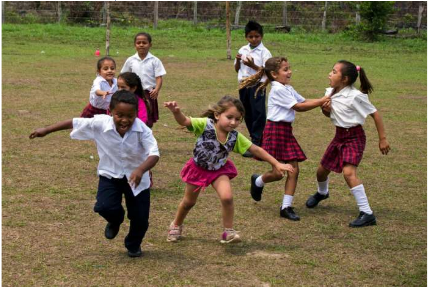
រូបភាពខាងក្រោម៖ កុមារកំពុងតែរត់លេងនៅក្នុងទីធ្លានៃសាលាបឋមសិក្សាមួយនៃ Santa Helena, Meta នៃប្រទេសកូឡុំប៊ី។