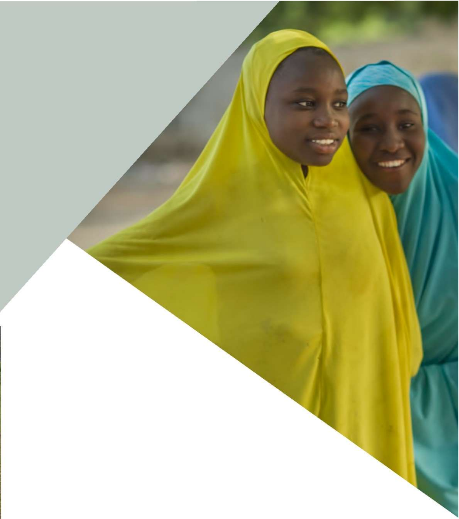
រូបភាពខាងលើ៖ នារីវ័យក្មេងនៅក្នុងភូមិ Ngamari ប្រទេសនីហ្សេរីយ៉ា ។